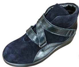
スウェードネイビー