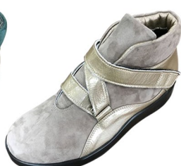
スウェードグレー